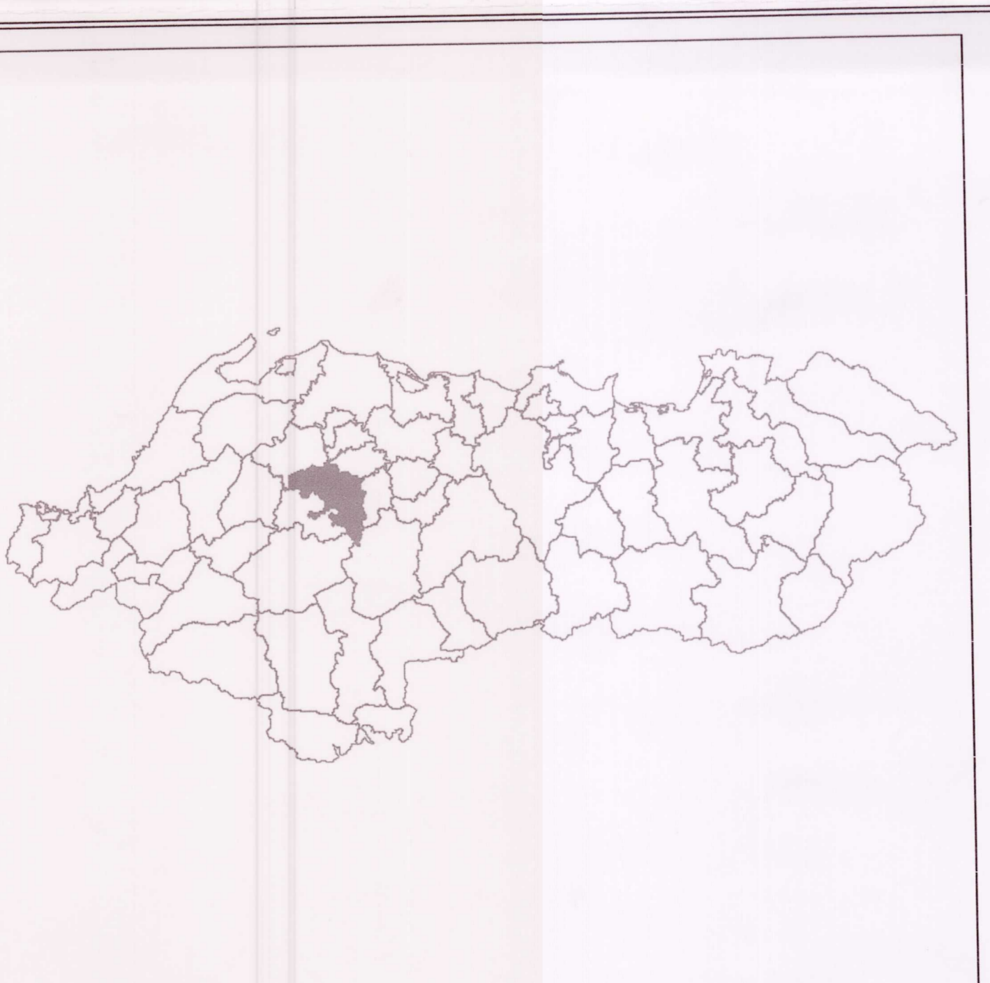
MIRATUAR ME VENDIMIN E KKT-SË NR. 3 Datë 29/11/2016